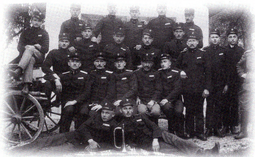
Gatinski gasilci v letu 1935