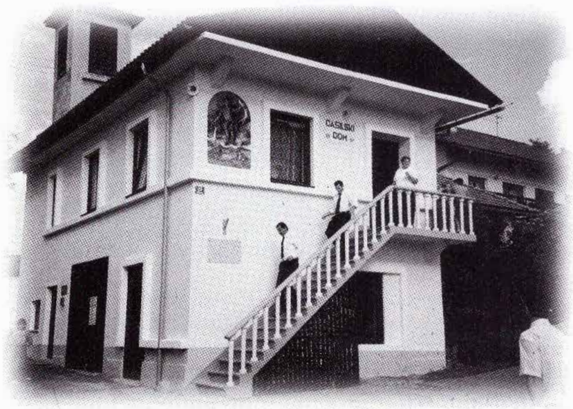
Polepšani gasliski dom PGD Gatina na Gatini.

PGD Gatina ima trenutno 84 članov, od tega 14 veteranov, 53 operativnih članov in članic ter 17 članov in članic gasilskega podmladka. Od tega so trije gasilci s činom višjega gasilskega častnika 1. stopnje, ena gasilka ima čin gasilskega častnika 1. stopnje, trije gasilci so gasilski častniki, ena članica in šest članov ima čin gasilskega podčastnika, deset gasilcev je izprašanih gasilcev 1. stopnje, devet gasilcev pa je izprašanih. Več članov sodeluje v organih OGZ Grosuplje in v organih GZ Slovenije.