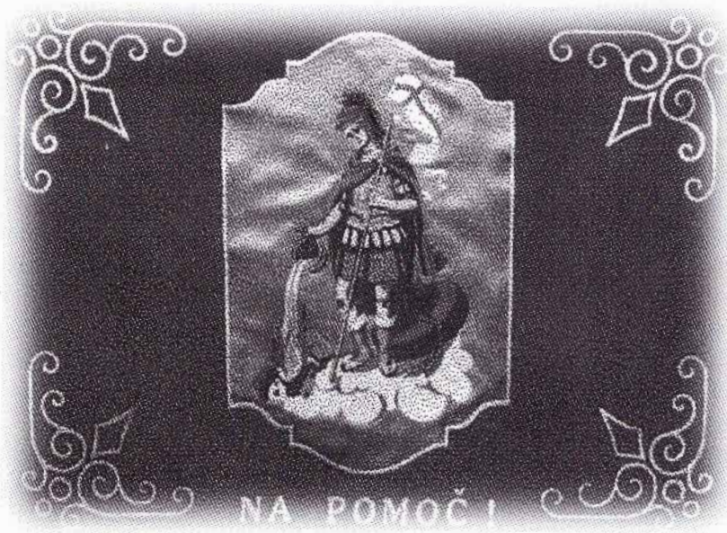
Slika novega gasilskega prapora s podobo sv. Florjana